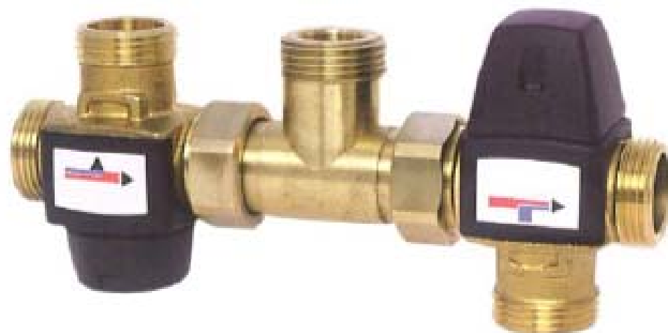
válvula misturadora (fria com quente) a saída do equipamento.